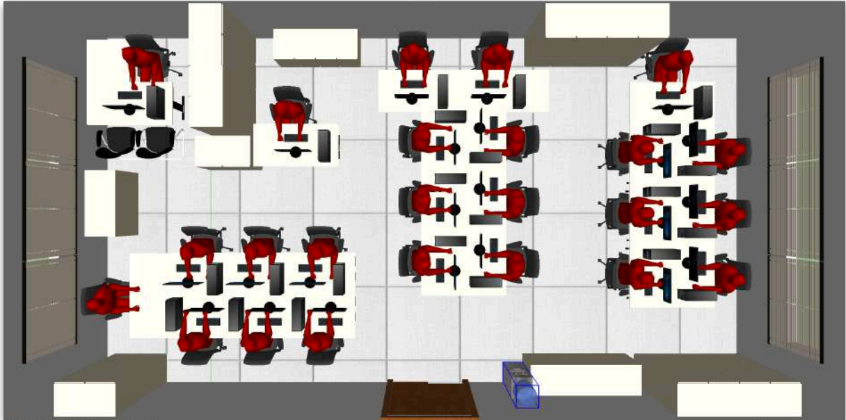
Figura 5: Esquema de distribuição de espaço da sala da Secretaria de Infraestrutura da Unifesspa

Nota-se que o espaço médio dedicado a cada pessoa que trabalha na SINFRA é de 2,56m 2 nesses inclusos ainda os espaços de circulação e atendimento. A exemplo da falta de espaços, assuntos mais delicados e que tenham caráter restrito ou confidencial devem ser discutidos no corredor devido proximidade dos postos de trabalho.