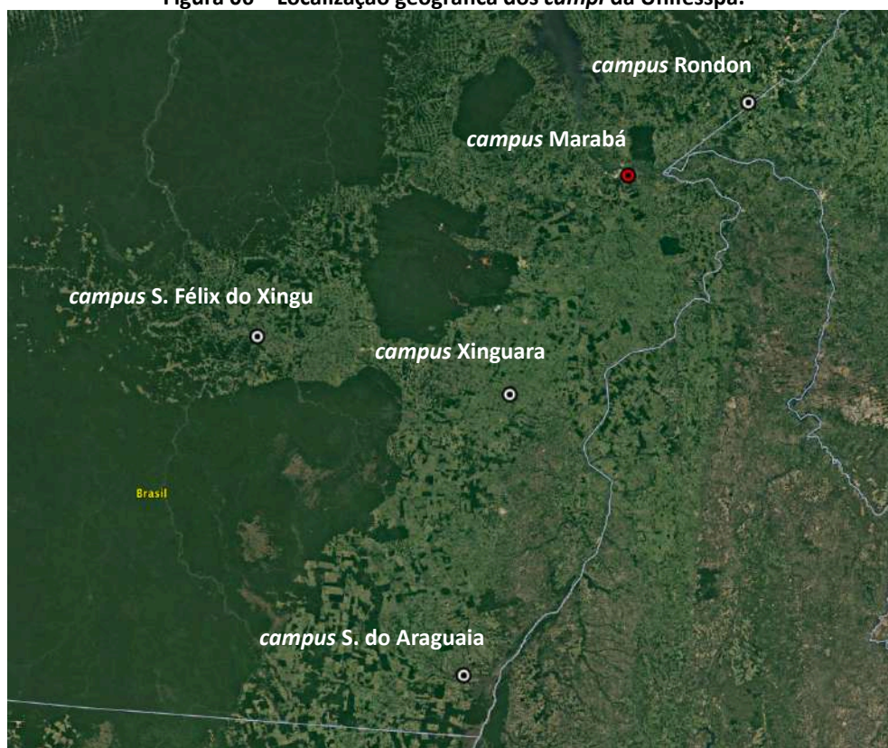
Figura 06 – Localização geográfica dos campi da Unifesspa.

Uma dificuldade geográfica entre os Campi , além da distância física, são as precárias condições das rodovias que os interligam, estrada de chão, asfalto em condições precárias, buracos, atoleiros, fatores que dificulta o acesso entre os Campi .